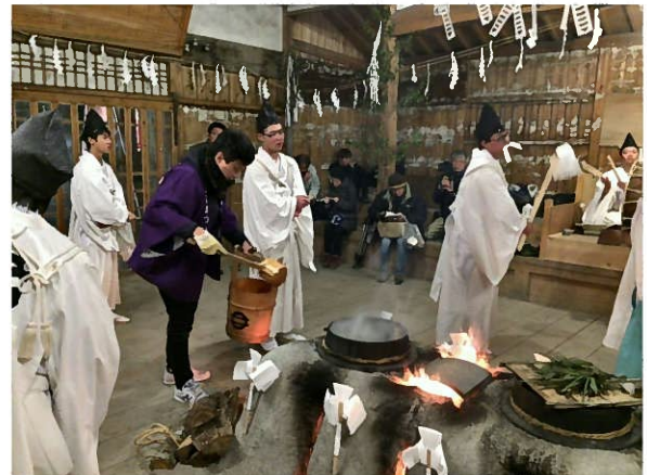
霜月祭（上町）での活動の様子 飯田信用金庫様