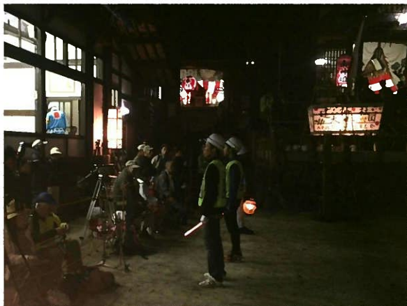
清内路手作り花火での活動の様子 飯田信用金庫様、みなみ信州農業協同組合様