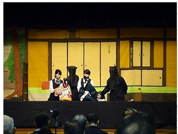
飯田女子高校人形劇クラブの実演