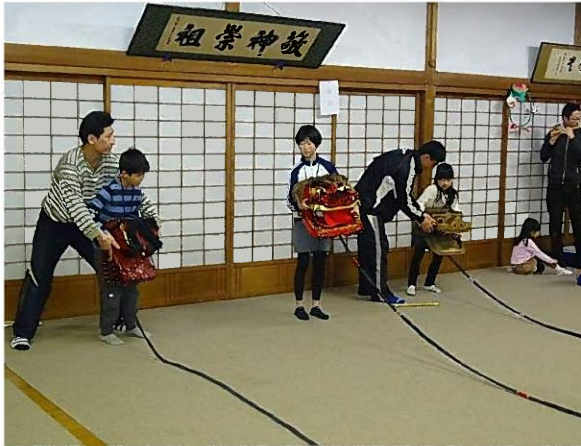
獅子舞体験の様子