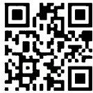
民俗芸能ナビ QR コード