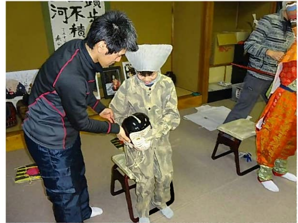
着付け体験の様子