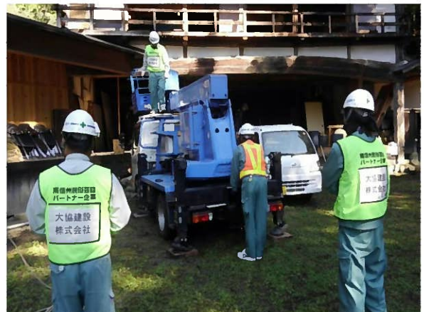
大鹿歌舞伎秋季公演での活動の様子 大協建設様