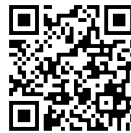
ツイッターQR コード